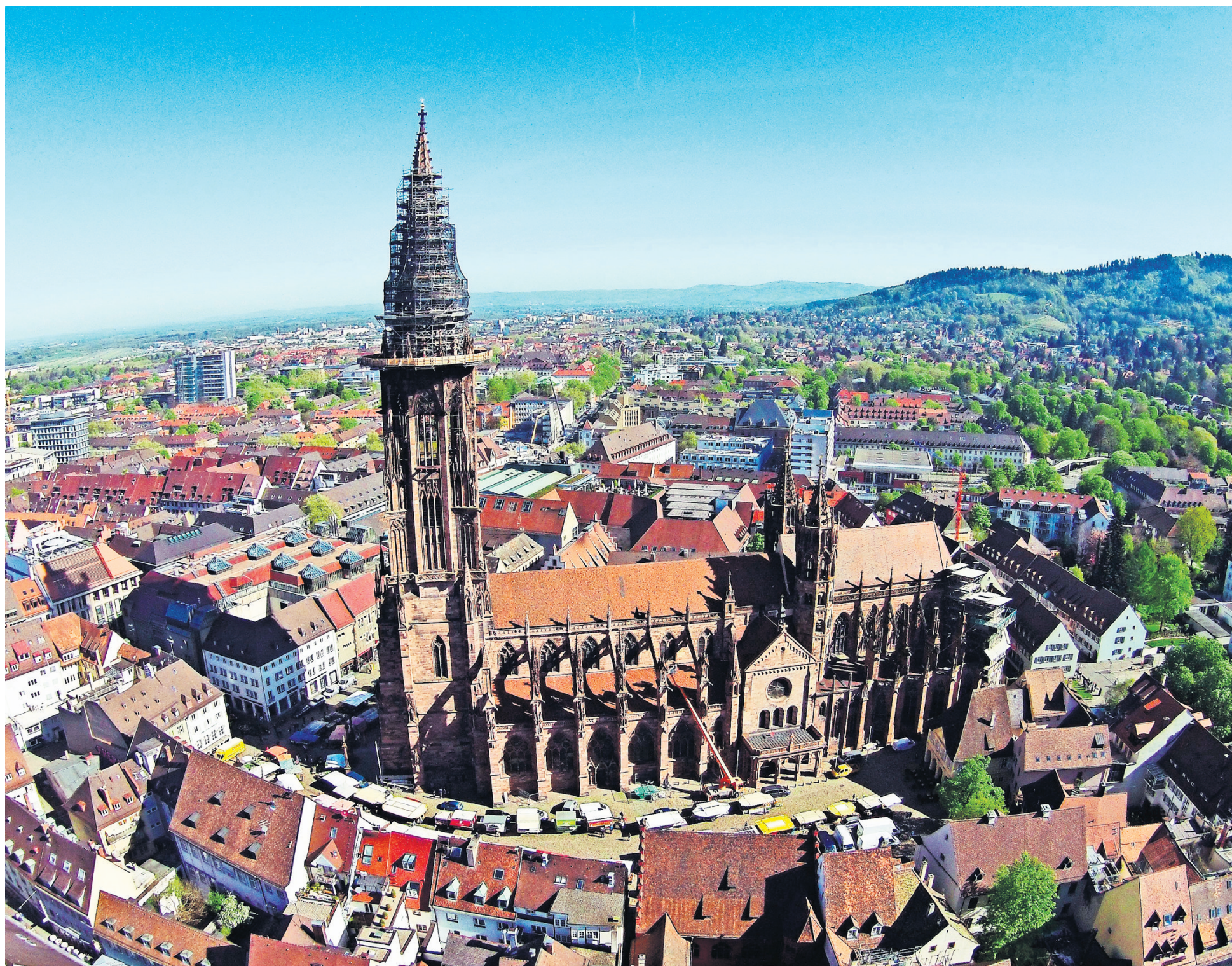
Das Freiburger Münster aus der Luft – der weithin sichtbare Mittelpunkt der Stadt.